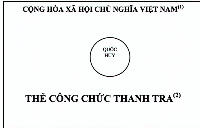
Hình 1: Mặt trước